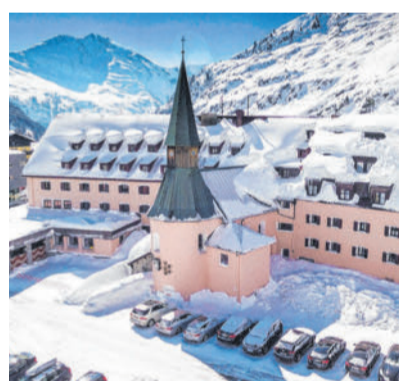
Im Frühjahr startet der Umbau des Arlberg Hospiz am Arlberg. SORAVIA