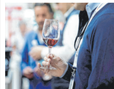
Exportiert wurden 203 Millionen Kisten mit jeweils zwölf Flaschen.

PARIS Die französischen Wein- und Spirituosenexporte haben 2021 neue Rekordhöhen erreicht. Der Auslandsumsatz wuchs laut Verband der Wein- und Spirituosenexporteure um 28 Prozent auf 15,5 Milliarden Euro.