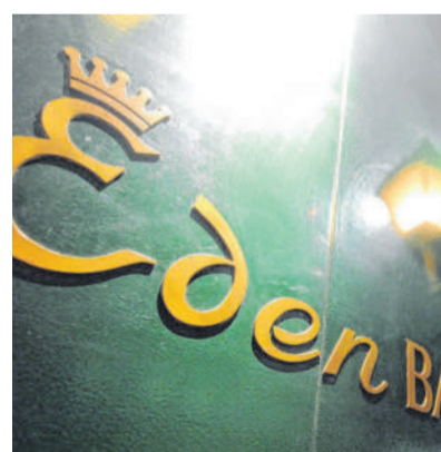
Auch die Eden Bar ist nun Teil der Soravia-Gruppe.